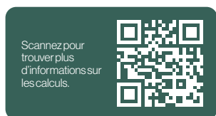
Exemple du Select Green 300